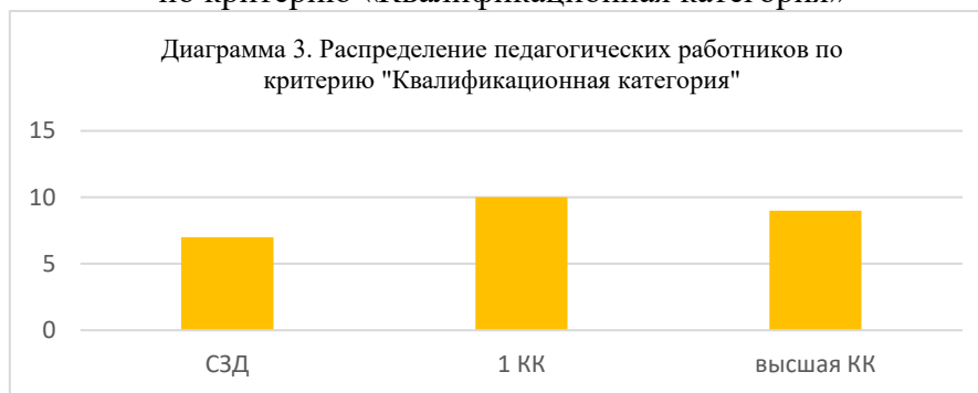
Рисунок 3. Распределение педагогических работников по критерию «Квалификационная категория»