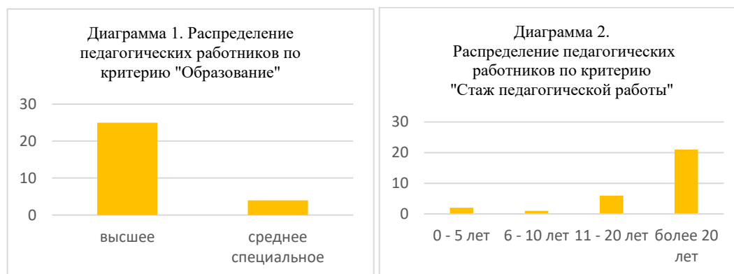
Рисунки 1, 2. Распределение педагогических работников по критерию «Образование», «Стаж педагогической работы»

Педагогический коллектив школы представляет оптимальное сочетание опытных педагогов, осуществляющих педагогическое наставничество, и молодых специалистов, активно повышающих уровень профессиональной компетентности (рисунок 2).